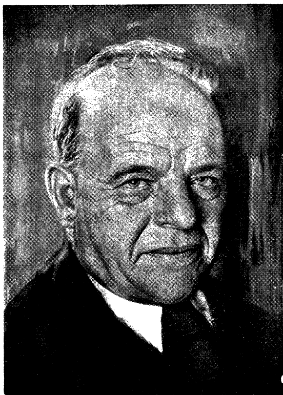
חיים נחמן ביאליק